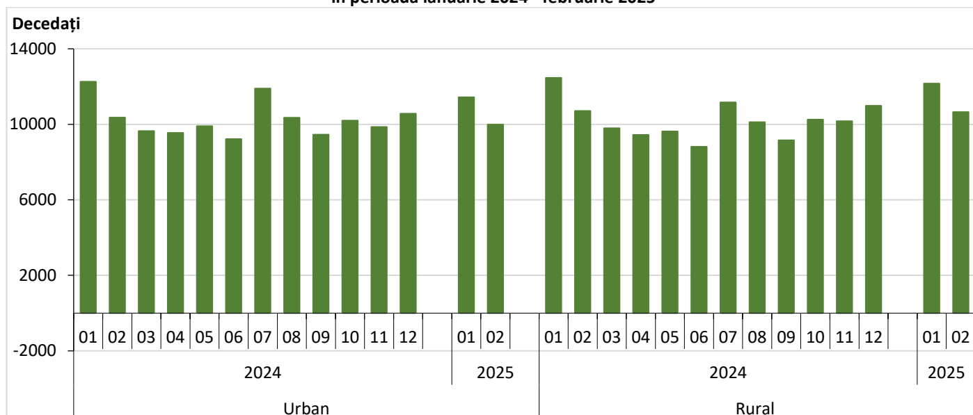
Fig. 3 Evoluția numărului de decese pe medii de rezidență, în perioada ianuarie 2024 - februarie 2025